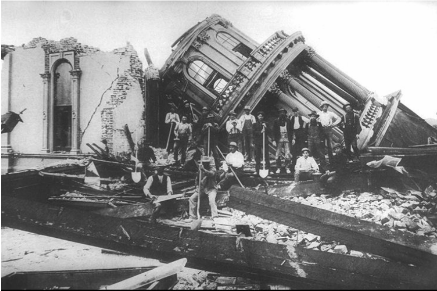
Santa Rosa Céntrico después del Terremoto 1906